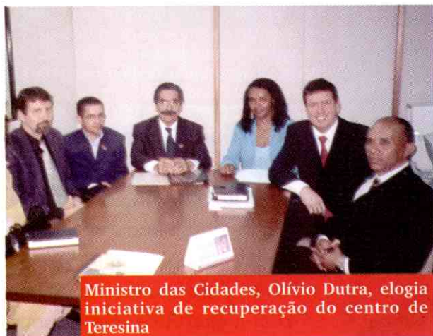
Ministro das Cidades, Olívio Dutra, elogia iniciativa de recuperação do centro de Teresina

O ministro Olívio Dutra mostrou-se bastante receptivo ao que lhe foi apresentado, fazendo, inclusive, elogios à iniciativa, que necessita da liberação de recursos para ser implementada.